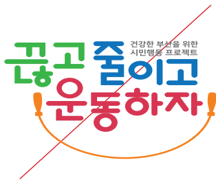
비례를 임의로 왜곡한 경우