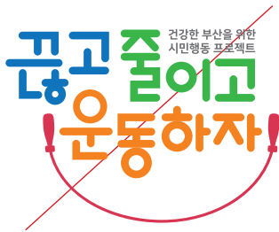
색상을 서로 바꿔서 적용한 경우