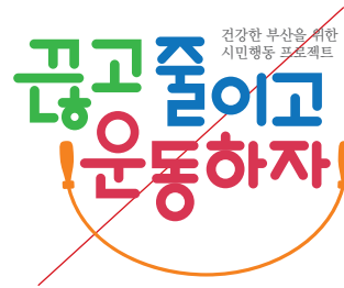
로고를 임의의 서체로 사용한 경우