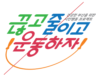
사체로 사용할 경우