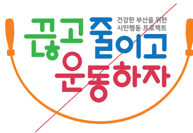
조합을 임의로 사용한 경우