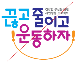
색상을 임의로 적용한 경우