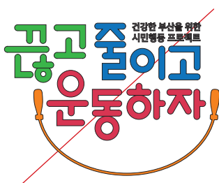
테두리틀린 두른 경우